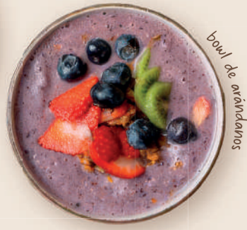
bowl de arándanos