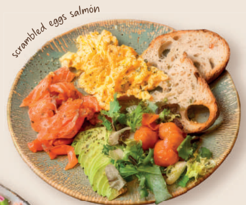
scrambled eggs salmon