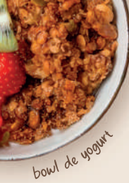
bowl de yogurt